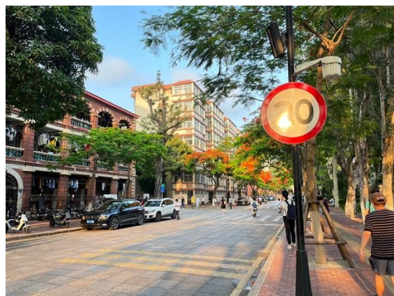
▶ 廈大鳳凰花樹及路旁景色

廈大毫無置疑地撐起中國最美大學之一稱號，依山傍海外，校園湖中央的芙蓉湖絕對是大家對於廈大的深刻記憶，陽光灑在湖面映照著水面波光粼粼對應著高聳的宋恩樓，許多黑天鵝暢遊在大湖之中，牠們都不怕人，常常上岸，晚課經過的時候要注意查看路面，以免撞上或踩到鵝大便。夏日的鳳凰花數開的火紅，不少的畢業生都與身後的鳳凰花樹拍出絕美的廈大記憶。