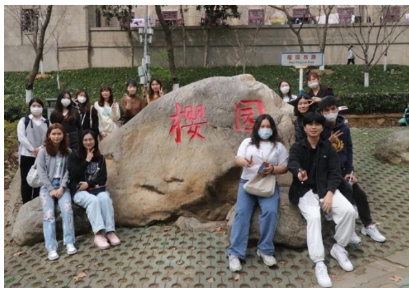
▶ 武漢大學的櫻花園

微信和QQ、小靈龍、雲閃付都是在校園生活能用度很高的app，可以提前下載，小靈龍可以查學生卡流水帳，充值宿舍的水電費，微信裡面有許多小程序，日後食物點餐，課堂點名都很方便，在學伴制度方面，廈門大學的台港澳辦王老師在2023春季的交換生在期中考後重新開始招募學伴，讓學伴和交流生一起參加活動，日後學伴制度應該會更加完善許多。此外，台港澳辦也常常組織活動，如果時間有空閒我很推薦參加，當時也是透過參加去武漢大學學術交流活動和許多交流生熟絡許多，也因此能一睹另一所最美大學風采，品嚐湖北當地特色吃食，是一個相當有趣的體驗。